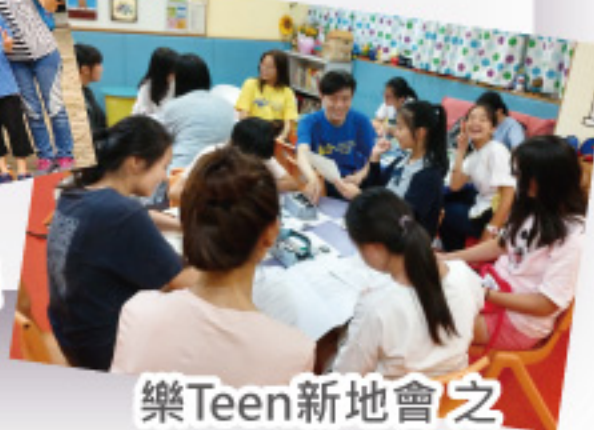
樂Teen新地會之 英語齊進步計劃