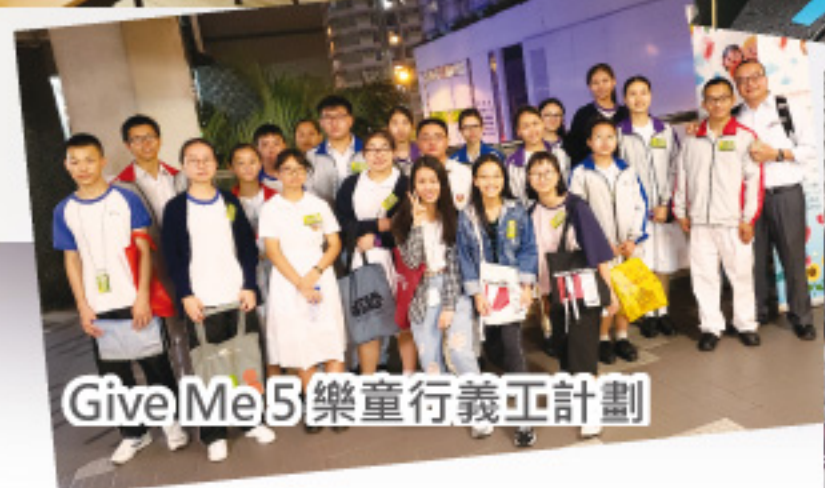
Give Me 5 樂童行義工計劃