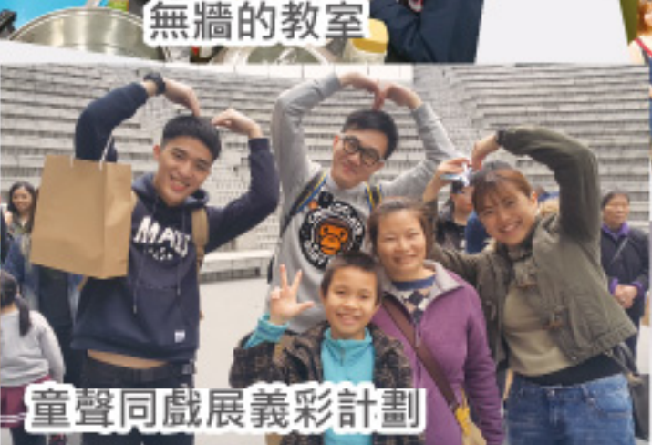
童聲同戲展義彩計劃