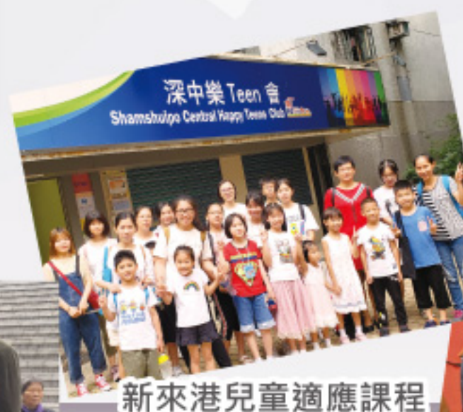
新來港兒童適應課程