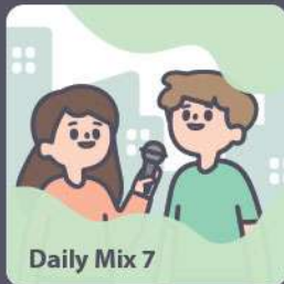
Daily Mix 7