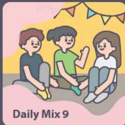
Daily Mix 9