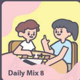
Daily Mix 8