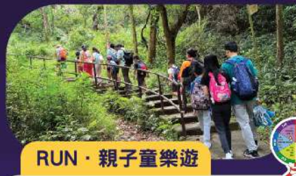
RUN · 親子童樂遊