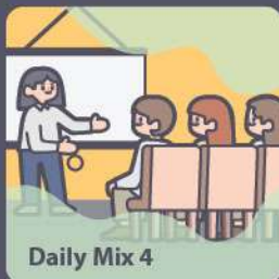
Daily Mix 4