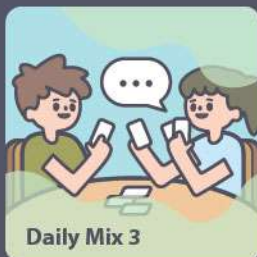
Daily Mix 3