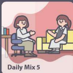
Daily Mix 5