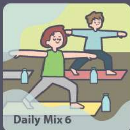
Daily Mix 6