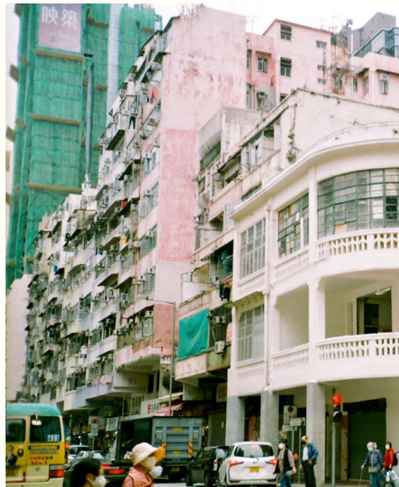
↑位於青山道301-303號的弧形轉角唐樓。

據考城學社2021年的統計，全港共有166棟戰前唐/洋樓，當中約30棟位於深水埗區，主要集中於北河街、南昌街及福華街一帶，其中12棟更獲歷史評級。獲評級的建築反映其具一定的歷史價值，應予以保存，但現時並沒有相關法例規管，業主有權自行清拆或改建。本團隊走訪深水埗12棟有歷史評級的戰前唐樓，發現大多保育情況未如理想。以被評為一級歷史建築物欽州街51-53號為例，其建築頂樓和內部樓梯殘破，彷彿隨時會倒塌，靠肉眼觀察可見外牆有不少斑駁的裂痕。另外，本區戰前唐樓現時用途甚廣，不少仍保留上居下舖的特色，如福榮街62號地舖為馳名的餐廳維記咖啡粉麵、醫局街170號地舖為售賣畫框的店舖。不過，亦有些唐樓的上層已人去樓空，日益破舊。