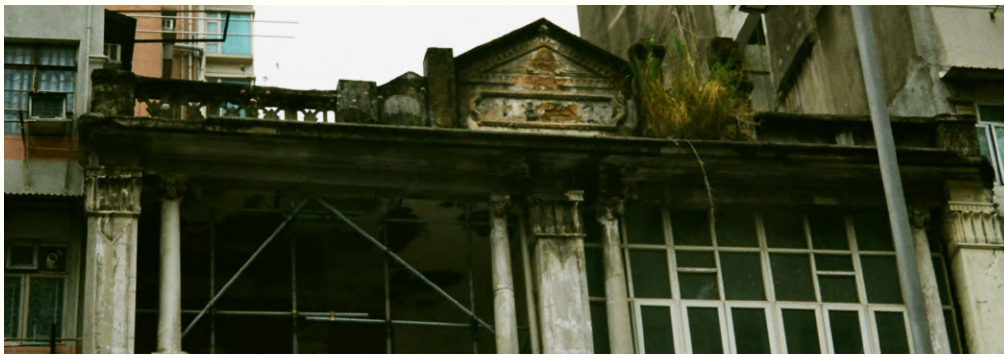
↑位於欽州街51-53號的戰前唐樓於1932年落成，屋頂刻有其落成年份，現被列為一級歷史建築。