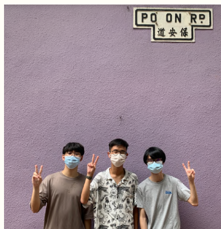
←本期《深言》成員的合照。

最後，或許就如年輕街坊所說，這些歷史痕跡不單是代表城市昔日面貌的「時代證明」，更是「香港證明」，印證着香港中西文化交融之獨特性，提醒我們香港一直以來都是一個海納百川、容下多元文化和不同差異的地方。