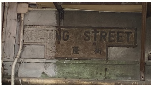
↑被牆漆覆蓋的基隆街T形路牌。

T形路牌主要源於1920年代，因時任港督司徒拔大規模更改街道名稱而設立的新型牌，並特地設有中、英文兩種語言方便華人與外藉人士閱讀。然而，隨時代變遷，大部分T形路牌已漸被拆卸、覆蓋，甚至不翼而飛，即使有保育人士要求加以保育亦未見改善，致使T形路牌逐漸消失。