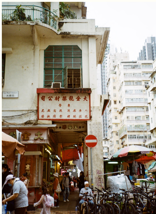
↑位於北河街58號的直角轉角唐樓。