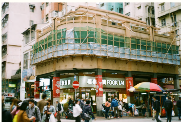
↑位於汝州街269號及271號的弧形轉角唐樓於本團隊實地考察時正進行維修工程。

遊走於深水埗區當中，不難發現各式各樣的戰前唐樓，但因保育翻新情況欠佳，很多時候都給予人「殘舊」、「不討好」的感覺，容易被街坊、途人忽略，更忽視了當中的歷史文化意義。據本團隊觀察，本區的戰前唐樓保育狀況較其他區差，大眾關注亦較少。以青山道301-303號為例，雖為罕有且完整的二級歷史建築，但樓宇長期丟空之餘更經歷清拆風波及大火等。反觀，同樣為香港僅存三幢的弧形轉角唐樓，位於旺角的「雷生春」卻保育成功更活化成為非牟利機構經營的中醫診所，完成修復之餘亦保留原有的建築特色，而港島區也不乏活化成功的例子。