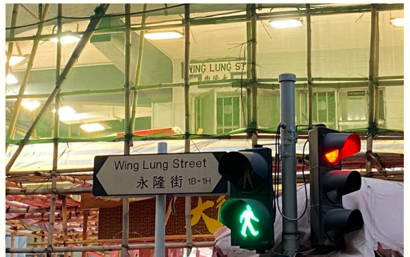
↑永隆街的新式路牌及T形路牌。

深水埗區議會亦曾指出政府保育工作不善，造成路牌不翼而飛的狀況頻生，望相關部門回收路牌並交給保育團體或設立博物館收藏。