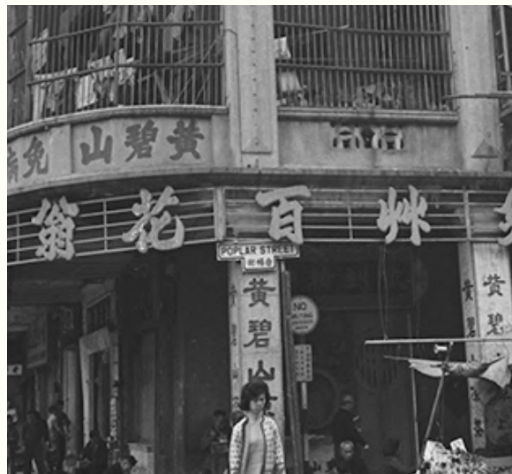
↑1966年白楊街的T形路牌。

T形路牌的特別意義在於 — 它是香港最早期象徵中西文化交融的官方基礎建設之一。據《清史稿》所載，路牌於嘉慶年間才出現於中國，而且大多路牌是以滿漢兩種文字製成，而香港則由英殖時期開始才逐漸出現路牌。然而，香港路牌早期仍以中式風格為主，到了十九世紀末才出現以中英文而製的T形路牌，充分顯示中西文化於香港交融。同時，T形路牌亦見證香港部分街道名稱的變遷，例如1954年8月「英皇子道」改名為「太子道」、1966年6月「田寮街」改為「福榮街」等。