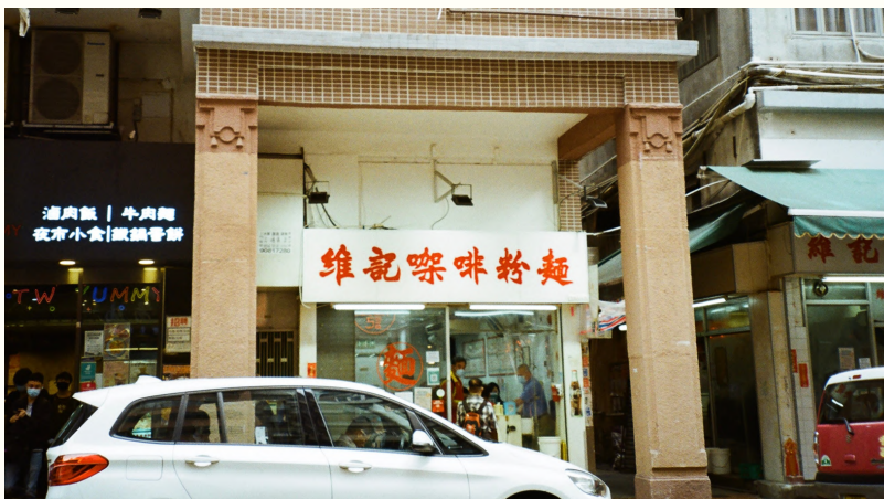
↑位於福榮街62號的戰前唐樓於1933年落成，現被列為三級歷史建築。